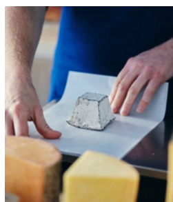
Métiers de bouche, Agroalimentaire