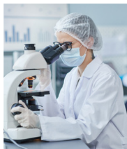
Santé, Pharmacie, Environnement, Sport