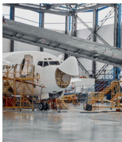
Aéronautique, Défense, Automobile