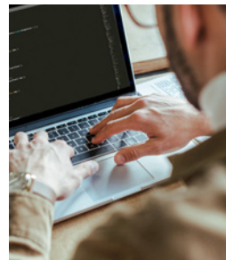
Informatique, Digital, Développement