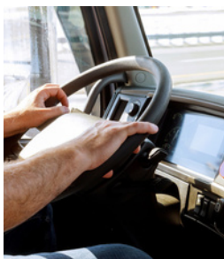
Transport, Logistique, Mécanique